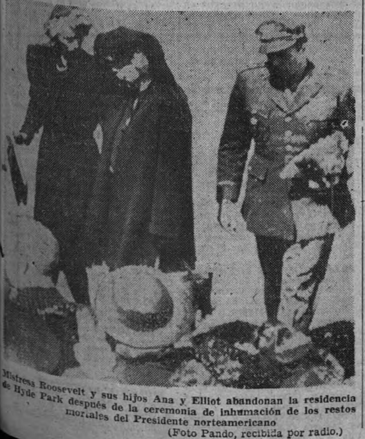
Mrs. Roosevelt y sus hijos Anna y Elliot abandonan la residencia de Hyde Park después de la ceremonia de inhumación de los restos mortales del Presidente norteamericano

Zuiderzee y han empezado a inundar la zona de Hilversum, al norte de Utrecht. Las aguas del Zuiderzee y del Lek pueden llegar hasta las inmediaciones de la última de estas ciudades, si bien ella no es susceptible de inundación. Las unidades inglesas han cortado el ferrocarril de Berlín a Bremen, después de romper un avance de más de veinte kilómetros. Las tropas del séptimo Ejército blindado han llegado a cuarenta y ocho kilómetros de Hamburgo. El segundo Ejército blindado se encuentra a veintitrés kilómetros del Elba. Treinta y dos mil alemanes han sido capturados en la bolsa del Ruhr por el primer Ejército norteamericano. La mayor parte de los soldados alemanes llegaron a las líneas aliadas en sus propios vehículos de transporte, anuncia Londres. Ha sido vencida casi por completo la resistencia alemana en la bolsa del Gironde, comunican desde París. Los alemanes se han retirado a las últimas posiciones de que disponen, situadas en la orilla septentrional de dicho río.