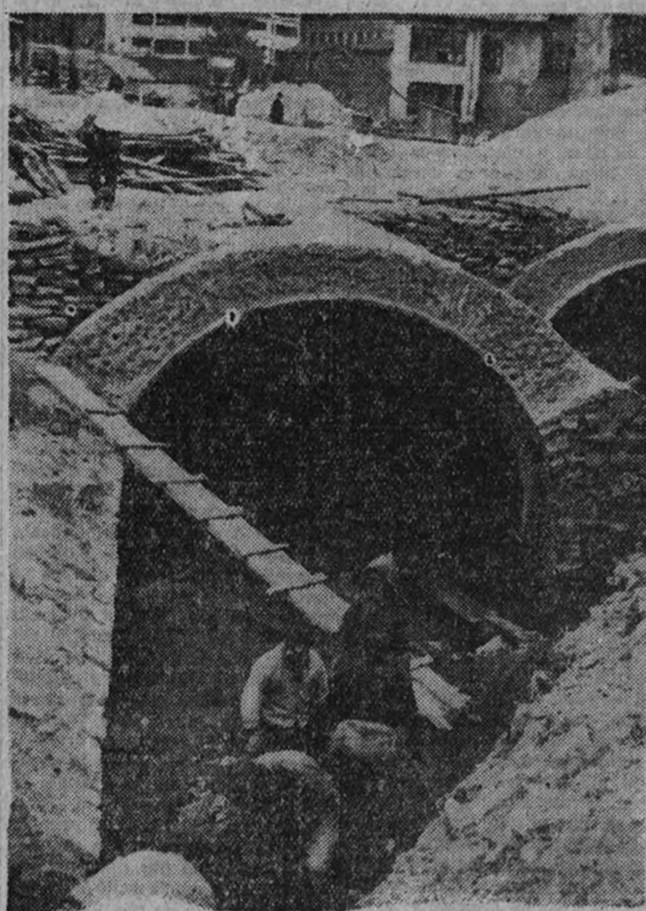
Obras de canalización y cubrimiento del río durante todo su cauce a través de Eibar

Por lo que se refiere a la zona de ensanche, ha sido rellenada una casi vertical vaguada con las tierras y piedras procedentes del descombro y desmonte llevado a cabo para construir las nuevas edificaciones, y ya han comenzado la construcción de edificios