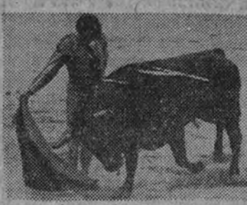
Llorente en un buen muletazo