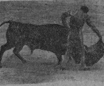
A chayo toreando de muleta