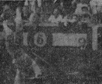
Cogida del mejicano