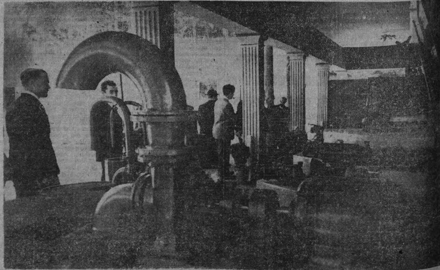
Vista de las instalaciones hidráulicas

No queremos terminar sin destacar los problemas que al fin de esta guerra pudieran presentarse a esta industria, queriendo atender por todos los medios a la resolución de los mismos, prestándose un especialísimo cuidado en cuanto a calidad y precios se refiere, único medio de poder competir con el extranjero, pues si bien una protección aduanera puede indudablemente proteger a la industria nacional, esto no puede ser, en modo alguno, más que una medida complementaria y esa competencia ha de vencerse, precisamente, mejorando las calidades de los productos, para lo cual es cada día más urgente el establecimiento de laboratorios de prueba y plataformas de ensayo, así como el establecimiento de la marca de calidad; que con tanto acierto influye en sus conclusiones presentadas al III Consejo Sindical por el Sindicato Nacional del Metal.