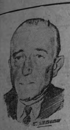
James Francis Byrnes

Director de la Junta de Producción de Guerra norteamericana, se habla de él como posible sustituto de Stettinius cuando termine la Conferencia de San Francisco.