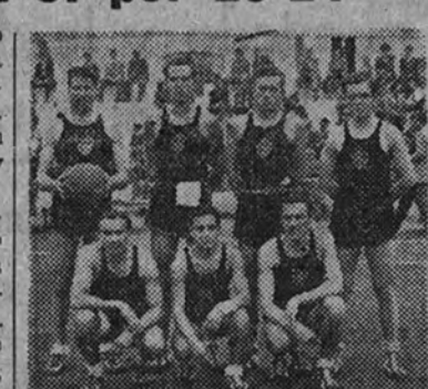
El América, que ha vencido al S. E. U. en la cancha de la Universitaria