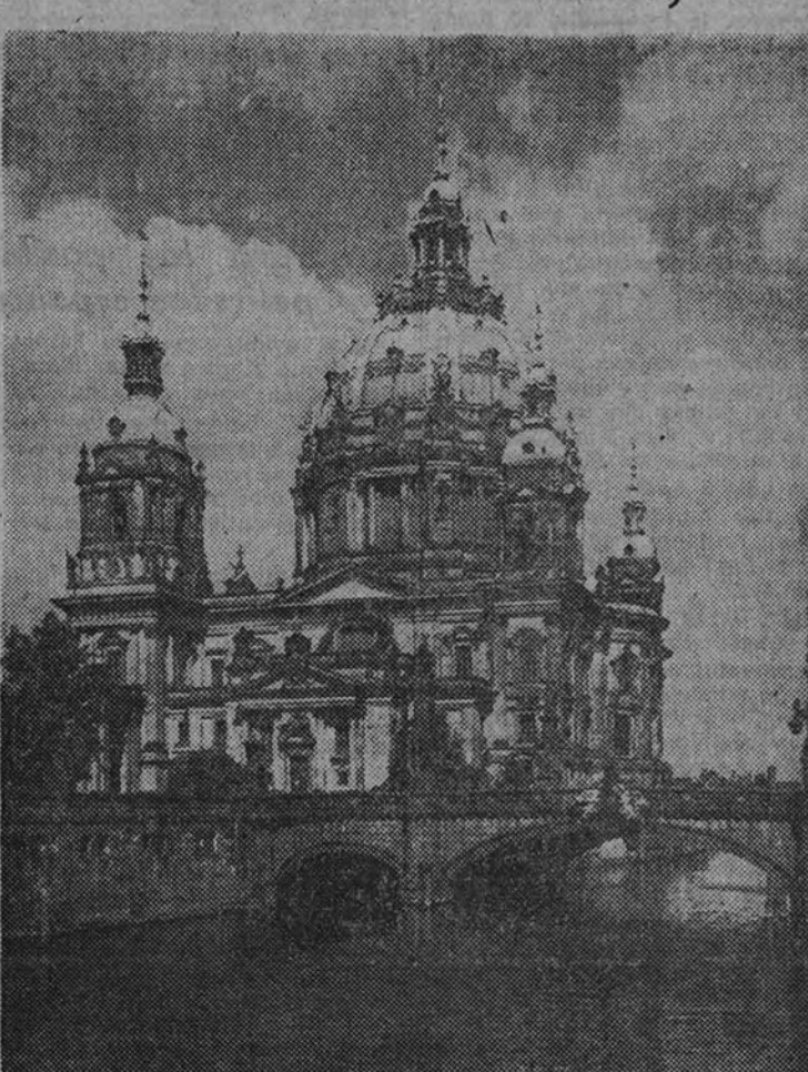
La catedral de Berlín

Radio París anuncia que aliados y rusos han establecido contacto en Wurzen, al oeste del Elba