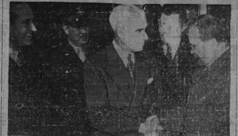
El secretario de Estado, Edward R. Stettinius, saluda a Molotov, comisionario soviético de Asuntos Exteriores, a su llegada a Washington