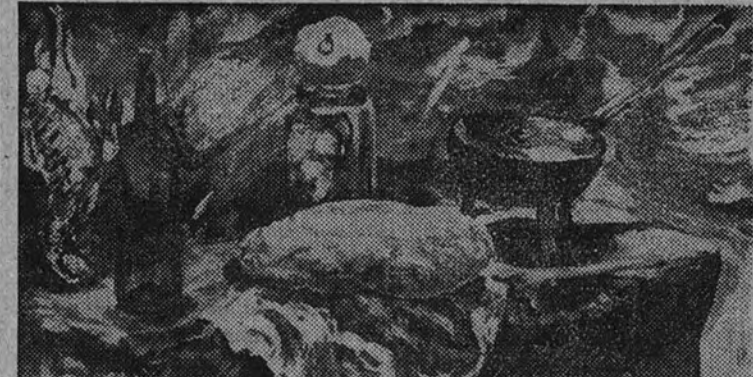
"Bodegón del pan", por B. Palencia

III. Las más diversas tendencias de la pintura actual están representadas en la Exposición de Floreros y Bodegones de Artistas Contemporáneos. Los salones restantes del Museo de Arte Moderno acogen la mayor parte de las obras postimpresionistas o intimamente relacionadas con las formas de vanguardia. Cossío es una figura singular en cuyas obras alcanza nuestra pintura más inquietud el punto máximo de refinamiento. Sus bodegones son un producto decantado, en el que la preocupación de hallar un ámbito trascendente a las cosas se resuelve en una expresión vagorosa y sutil, de formas huidizas, casi deshechas, que anota las más exquisitas armonías y colidencias. Tras esta representación esencial, late, no obstante, una sólida construcción y equilibrio. En términos de mayor vaguedad está resuelto el cuadro de Delvó Bueguet y el de Eduardo Vicente, apenas centrado en el género, con su flora espectral de seda japonesa o de bombo. Ambos artistas reducen el área de los valores pictóricos con su alejamiento de toda concreción. Porque, aparte de que la esencia de una cosa no es la cosa misma, sólo en la re-