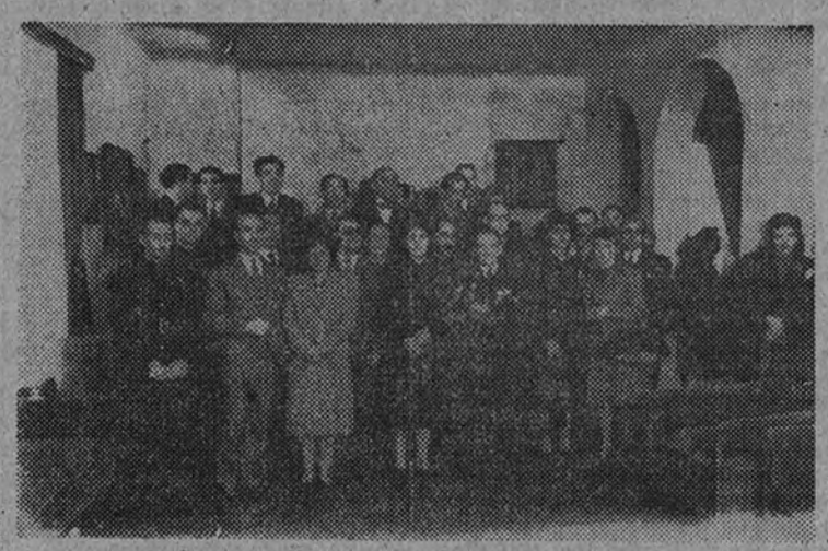
La Delegada Nacional de la Sección Femenina y el Jefe Nacional del S. E. U. asisten a la recepción celebrada en honor de los Jurados que han presidido los Concursos de la Falange Femenina

En la mañana de ayer se celebró en el Círculo Cultural "Medina" una reunión de músicos y críticos musicales que han intervenido en los Concursos Nacionales de Coros y Danzas que la Sección Femenina viene celebrando.