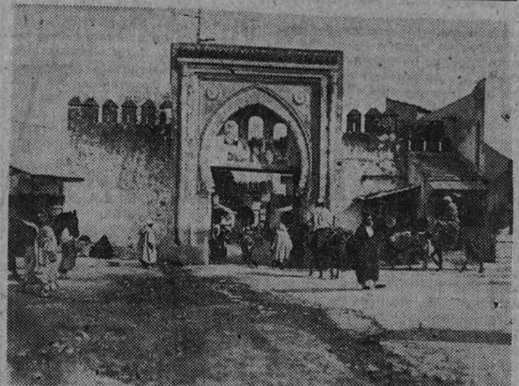
Una puerta de Tánger

En las geografías editadas a principios de siglo los autores nunca estaban de acuerdo acerca de la población de Marruecos. Unos la estimaban en cinco millones de habitantes, mientras los más optimistas hacían llegar sus cálculos hasta la cifra de doce millones. En la que solamente le concedían tres los que generosamente le otorgaban doce, se hallaban quietos en un millón de millones de millones de una de las cifras, aproximándose a la otra.