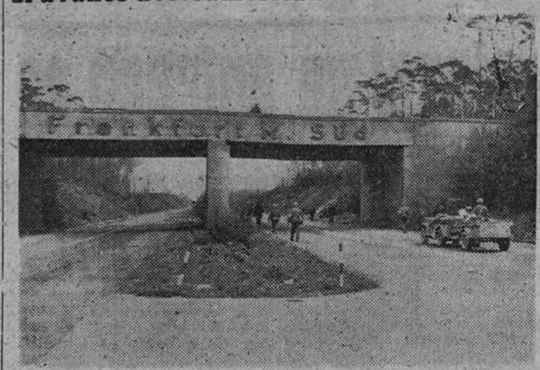
Fuerzas norteamericanas pertenecientes al III Ejército, del general Patton, durante su avance por la autopista que conduce a Francfort del Main