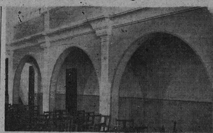
Detalle de un lateral del salón de actos del Hogar-Cuartel "Carlos de Azcarraga".

Las instituciones modelo, tanto por sus instalaciones como por su funcionamiento admirable y ejemplar, especialmente en lo administrativo, que bien merecen extensión aparte en nuestra crónica.