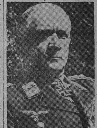
Ritter von Greim

Los predecibles de tasación y condiciones de la subasta se detallan en el anuncio que queda expuesto al público en los Talleres de este Instituto en Madrid, Fernando IV, 18, y en las Oficinas de las Delegaciones de Badajoz, Córdoba, Sevilla, Talavera de la Reina y Liria.