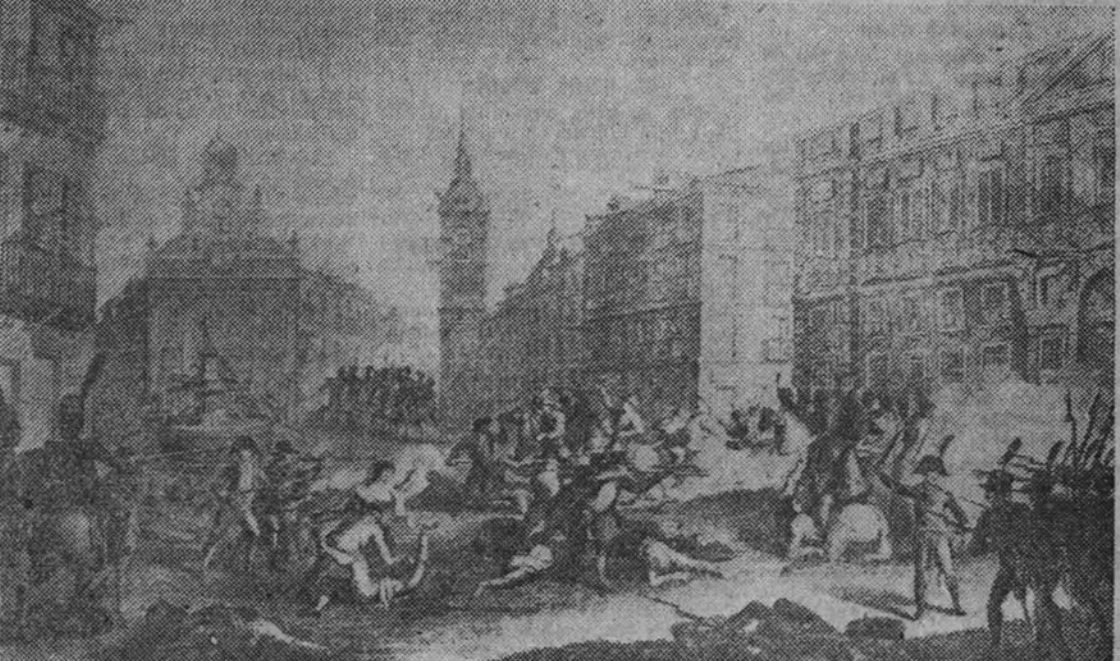
Las luchas en la Puerta del Sol, según un grabado de la época