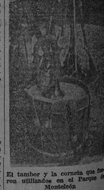
El tambor y la corneta que fueron utilizados en el Parque de Monteleón