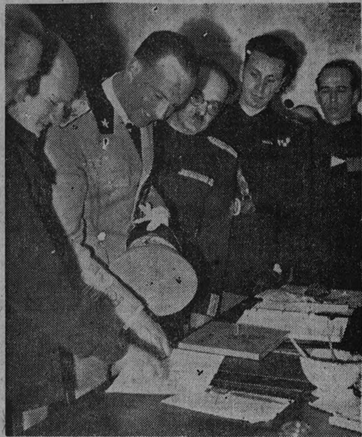
El príncipe Humberto acompañado de los jefes del fascismo italiano visita «El Covo», el famoso despacho de Benito Mussolini en el Pópolo d'Italia.

Después de medianoche, un camión de guerrilleros fuertemente armados llegó ante el edificio y se abrieron a balazos la fachada. El príncipe, que dormía en la parte interior, salió ileso, lo mismo que los demás miembros de su séquito. (Efe.)