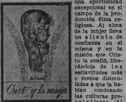
Cristo y la mujer

En este sentido, el libro del doctor Ketter, profesor en el Seminario de Tréveris, es de una oportunidad excepcional en el campo de la producción ética religiosa. Al alma de la mujer lleva a un aliento de confianza en sí misma y en la misión que Cristo le confió, librándola de la esclavitud más o menos disimulada a que la habían condenado las culturas pre-cristianas.