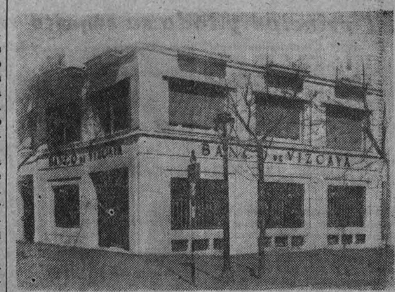
Fachada de la nueva Agencia Urbana del Banco de Vizcaya en la glorieta de Quevedo

Uno de los hechos más elocuentes del resurgir del comercio y de la industria madrileña y en general de toda nuestra economía a partir de la total liberación, es el desdoblamiento de nuestras primeras entidades bancarias, que se sienten congestionadas en sus grandes Centrales, pese a la amplitud y magnificencia de sus modernísimos palacios. El volumen de las operaciones adquiere tal importancia, que casi todos los Bancos tienen que establecer nuevas Agencias Urbanas, que al descongestionar la oficina Central brindan al público la comodidad de efectuar todas sus operaciones sin la menor pérdida de tiempo, cosa esencial para todas las actividades comerciales.