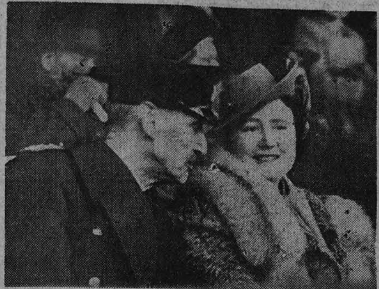
El Rey Haakon de Noruega presencia, en unión de la Reina de Inglaterra, un partido de fútbol en el estadio de Wembley

Hemos dicho anteriormente que la construcción de fortificaciones comenzó en 1941. Así fue, en efecto, y se emprendió la fortificación de las bases navales escondidas en los fiordos, donde hoy se encuentran los restos de la Flota alemana, constituida por un buque de línea, algunos cruceros y por lo menos, dos centenares de submarinos. Pero estas fortificaciones no estaban realizadas para prevenir un ataque general. Fue en 1942 cuando Hitler dio orden de que Noruega, hasta entonces vulnerable, se