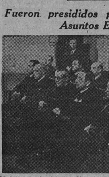
El Ministro de Asuntos Exteriores, señor Lequerica, presidiendo los funerales por don Ginés Vidal Saura, celebrados ayer en la Iglesia de la Concepción

Fueron presididos por el Ministro de Asuntos Exteriores