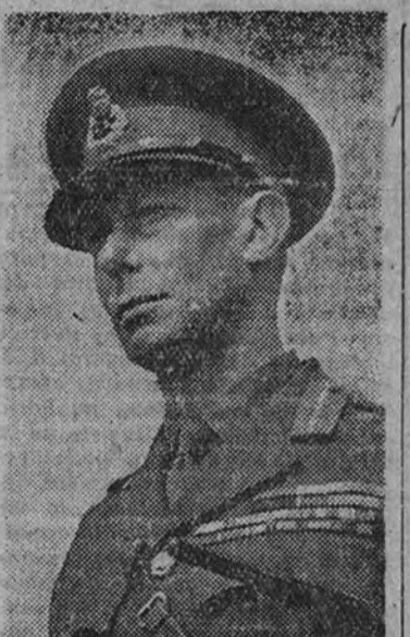
Discurso de Jorge VI

No olvidemos, estimados compatriotas, la tristeza y el desaliento (Continúa en cuarta página.)