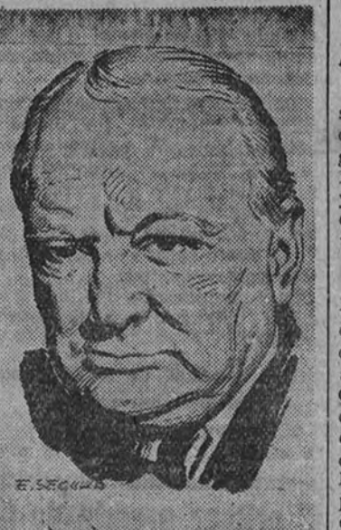
Declaración de Churchill

"Hoy damos gracias a Dios por un gran acontecimiento. Hablando desde la ciudad más antigua del mundo (Continúa en cuarta página.)