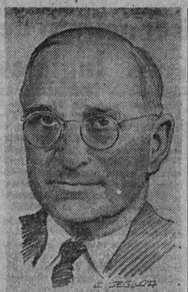
Discurso de Truman

WASHINGTON 8.—Con motivo del Día de la Victoria de las Naciones Unidas en Europa, el Presidente de los Estados Unidos, Harry S. Truman, ha pronunciado el siguiente discurso: