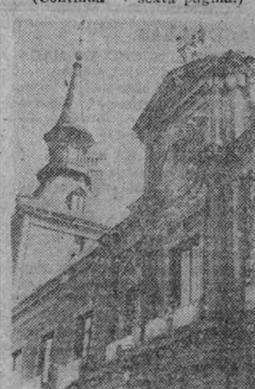
En el Ministerio de Asuntos Exteriores fué izada la bandera española y adornados los balcones con colgaduras

Ayer tarde, el embajador de los Estados Unidos en Madrid, mister Armour, recibió a la colonia de su (Continúa en sexta página.)