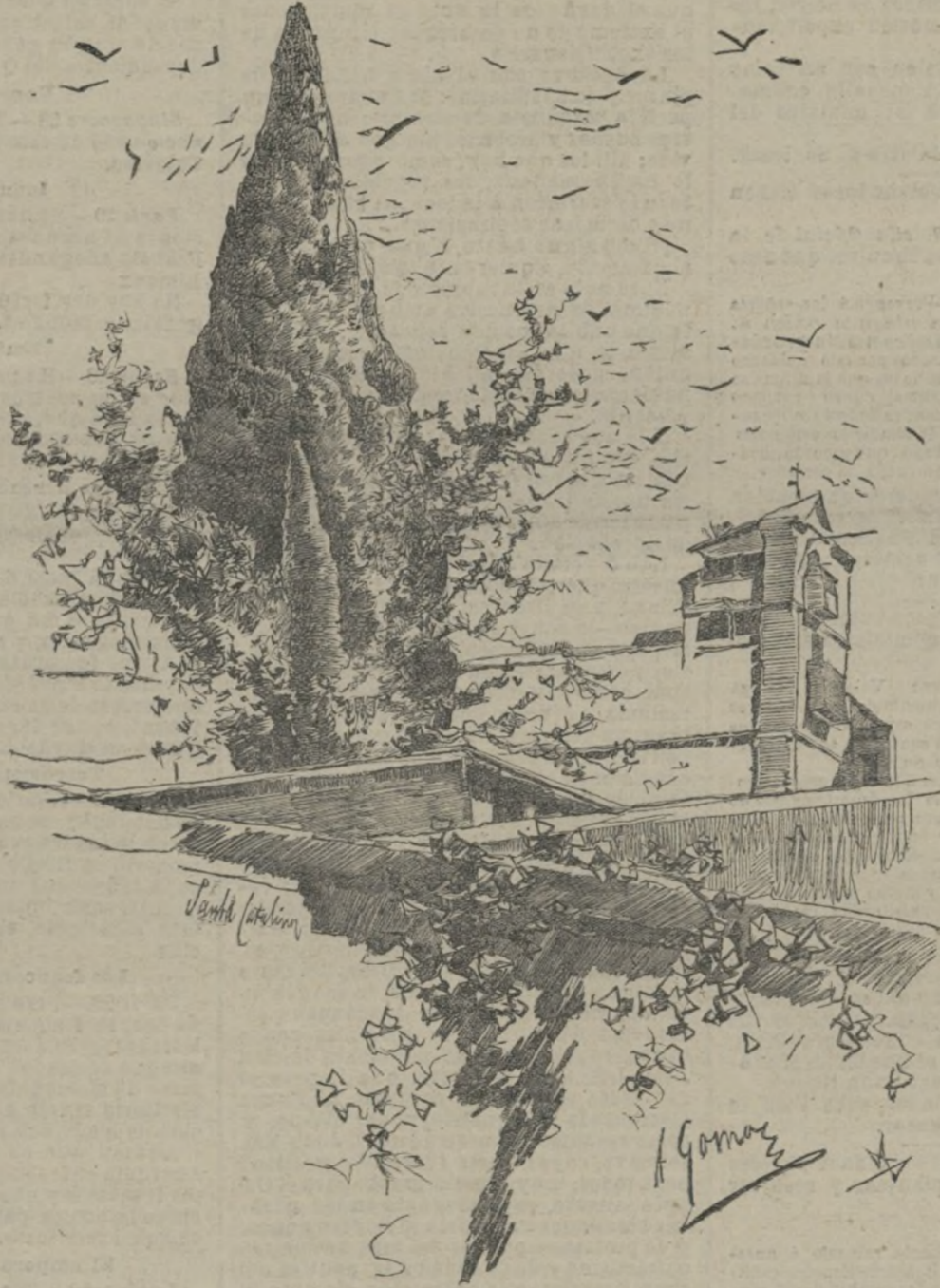
GRANADA.—Convento de Santa Catalina.

Para el año económico de 1879-80 las ganancias declaradas sumaron 185 millones de libras esterlinas (4.825 millones de pesetas), cobrándose el impuesto sobre 39 millones de libras (975 millones de pesetas). Diez años después, en 1889-90, la suma de beneficios se declaró por 239 millones (5.975 millones de pesetas) y el «income-tax» se devengó sobre 70 millones de libras (1.750 millones de pesetas).