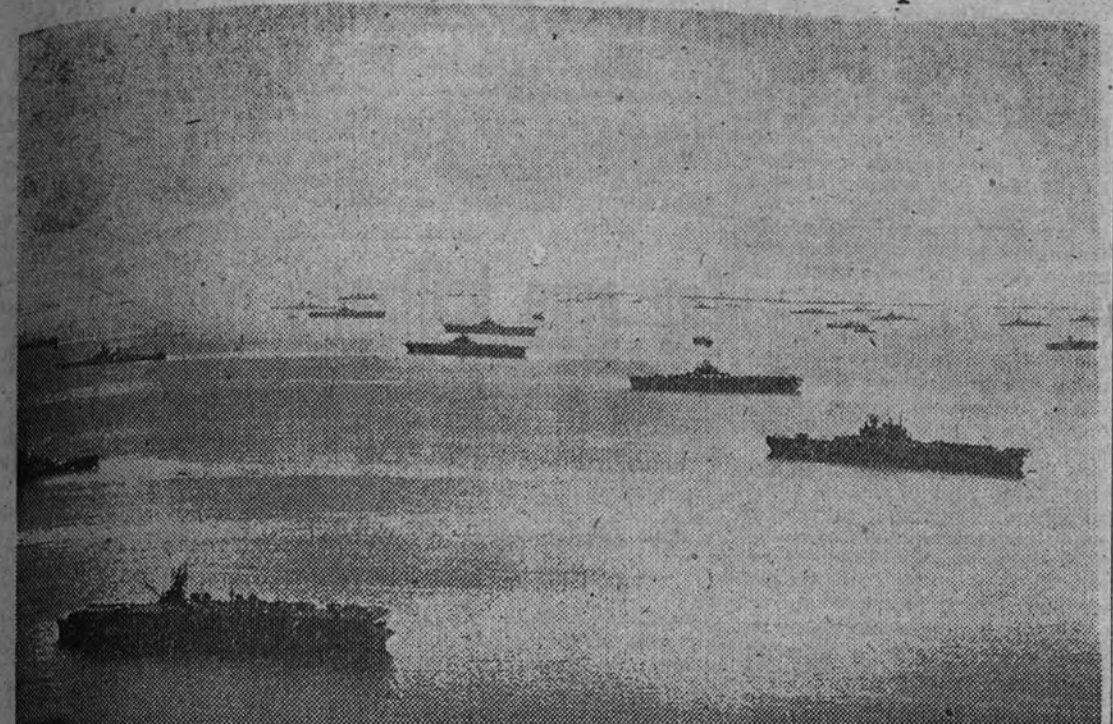
Unidades de superficie de la Escuadra norteamericana ancladas frente a las islas Marshall

El poder naval aliado tendrá gran importancia en la situación política europea