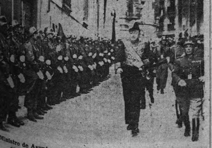
El Ministro de Asuntos Exteriores, señor Lequerica, pasa revista a la compañía que le rindió honores a su llegada a Toledo

En el pretérito de la etapa final de su derrota, el Japón no puede contar con la más leve simpatía de los españoles. Nos parece mal que estén decididos a hacerse el “harakiri”, pero nos resulta más incómodo que nos lo hagan a los demás.