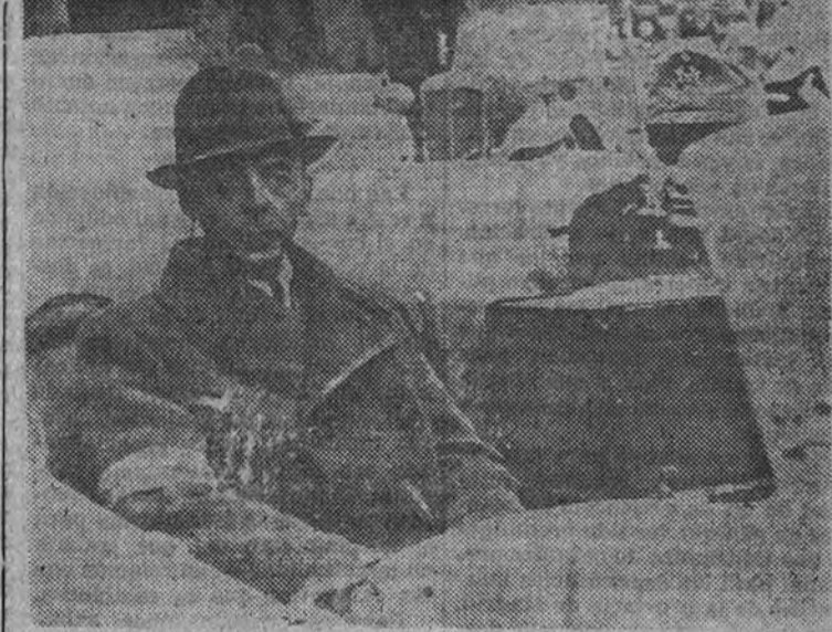
El general Bor, jefe de la sublevación en Varsovia, detenido por los alemanes

MUENAU (Alemania) 11. (Servicio especial de crónicas Efe-United Press).—El general Bor, jefe de los patriotas de Varsovia que dirigió el levantamiento de la capital polaca contra los alemanes, ha declarado a un corresponsal del periódico americano "Stars and Stripes" que las fuerzas rusas llegaron a estar a sólo quinientos metros de las líneas polacas, pero que no pusieron empeño en unirse con ellas, ya que nunca atacaron con efectivos superiores a un batallón. Bor ha declarado que fue él quien dio la señal de sublevación, porque creyó que la proximidad del Ejército rojo era el momento oportuno para luchar por la liberación de Varsovia. El general polaco se negó a hacer comentarios de la ayuda prestada por los rusos a los patriotas varsovianos a través del Vístula. Sólo, como hecho concreto, refirió la extraordinaria cercanía de las divisiones rusas a las fuerzas polacas y sus limitados intentos para salvarlas.