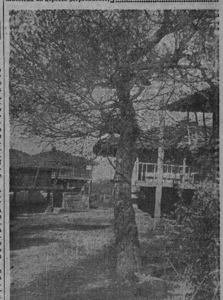
El maíz ha recibido la gracia de la lluvia y los hórreos podrán colgar ya las abundantes y doradas «cristas de panoyas» de maíz