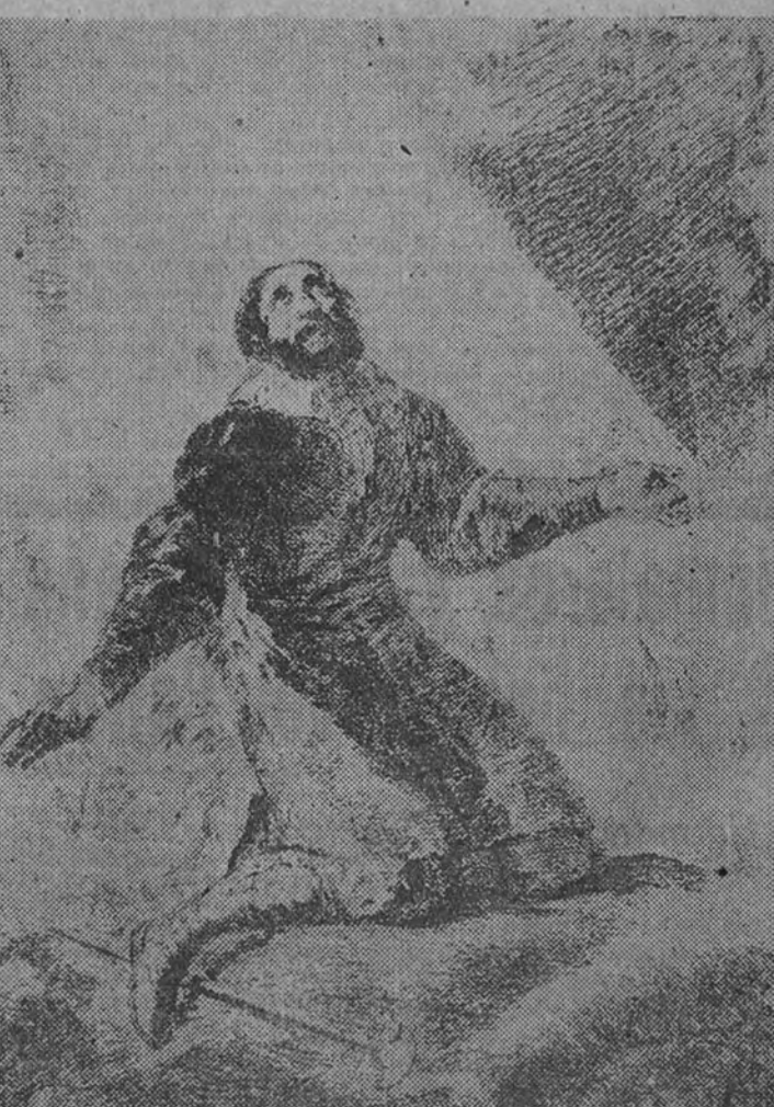
San Isidro, Patrón de Madrid, tiene este año sobre sí todas las miradas de los madrileños. La Corte ha hecho, al fin, la alabanza de la aldea, y se pasa por la ingrata lluvia urbana en servicio a lo otro: a aquello que quedaba tan lejano y que sólo la estampa del Santo nos aproximaba. Campo arado, lentos bueyes y un San Isidro, ataviado a la manera campesina. La escena pide ahora una lluvia ligera, de nubes que se disipan, de húmedo frescor. Que San Isidro, rogamus, haga este milagro, y la lluvia primaveral empape su bella y castiza ermita, a partir, por ejemplo—la romería es la romería—, de mañana... (La gudiñe de Goya, que se conserva en la Biblioteca Nacional.)