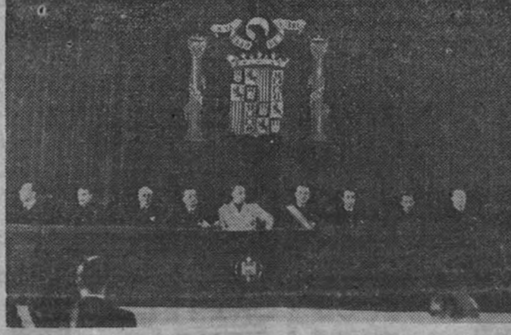
El Ministro de la Gobernación presidió el domingo la inauguración del XIV Congreso Nacional de Odontología

guerra está ya decidido desde los días de Iwojima y Okinawa. EMPIEZAN A SALIR TROPAS BRITANICAS PARA EL PACIFICO LONDRES 14.—Ha comenzado el transporte de tropas británicas que participarán en la guerra del Pacifico, según anuncia la agencia United Press. Las primeras fuerzas que han salido comprenden grupos especialmente adiestrados para la guerra en el Extremo Oriente. Varias escuadrillas de la R. A. F. han sido destinadas para dicho frente. (Efe.) LA MARINA INGLESA, AL PACIFICO. LONDRES 14.—El almirante (Continúa en cuarta página.)