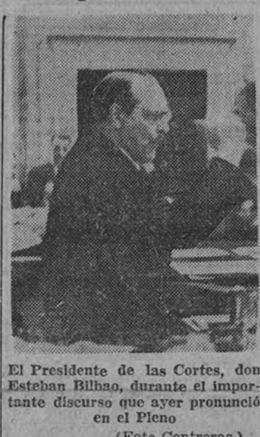
El Presidente de las Cortes, don Esteban Bilbao, durante el importante discurso que ayer pronunció en el Pleno

EL ADVENIMIENTO DE LA PAZ Pero no es ésta la única manifestación que me veo obligado a hacer hoy ante la Cámara. Un acontecimiento trascendental, universalmente celebrado, me obliga a decir algunas palabras en expresión de la solidaridad con que España, dotada siempre de un sentimiento de universalidad, atiende a la suerte del mundo, principalmente en estos instantes, de los que depende el destino de las generaciones futuras. Las Cortes Españolas, que ya en anteriores ocasiones, cuando el ardor de la guerra encendía las pasiones de los beligerantes y apenas si en el ambiente cargado de odios y de metralla se percibía otra voz serena que la del Sumo Pontífice, Vicario de Cristo y mensajero perenne de las fraternidades cristianas, hubieron de hacer votos fervientes por el pronto advenimiento de la paz, no pueden permanecer silenciosas a la terminación de la espantosa contienda que durante seis años inabarcables ha inundado de sangre todos los campos de Europa. (Continúa en cuarta página.)