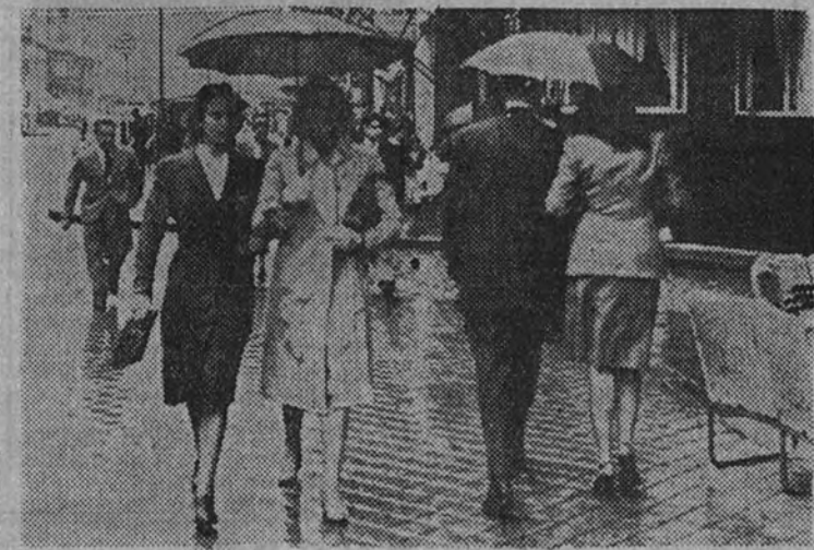
Ayer llovió en Madrid después de cinco largos meses. Los madrileños pasearon muy gustosos y alegres, luciendo los paraguas, gabardinas e impermeables, que estaban ya apollándose por falta de uso, como puede verse en esta foto de nuestra camarada Contreras

En Málaga está lloviendo a última hora de la tarde con alguna intensidad. En las demás regiones la lluvia caída es insignificante. En general, donde más ha llovido ha sido en la región central: Toledo, dos decimas; Albacete, dos decimas; Burgos, igual; Soria, cuatro decimas. Ni siquiera se ha llegado al litro. Igual ha ocurrido por el Norte en la zona del Cantábrico. En Galicia no ha habido lluvia. El cielo ha estado muy nublado en toda España, a excepción de Cataluña, que ha tenido todo el día cielo despejado. Mañana, martes, parece que seguirá como hoy; con tendencia a despejarse todavía más el cielo.