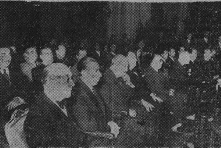
La presidencia, en los funerales por Joselito