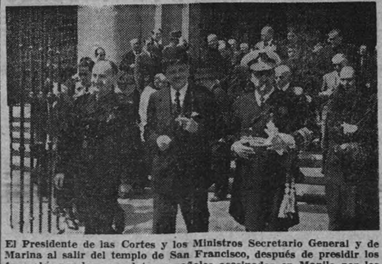
El Presidente de las Cortes y los Ministros Secretario General y de Marina y el Presidente de las Cortes

LLEGA A COPENHAGUE EL GOBERNADOR DE BORNHOLM COPENHAGUE 18.—Proceden-