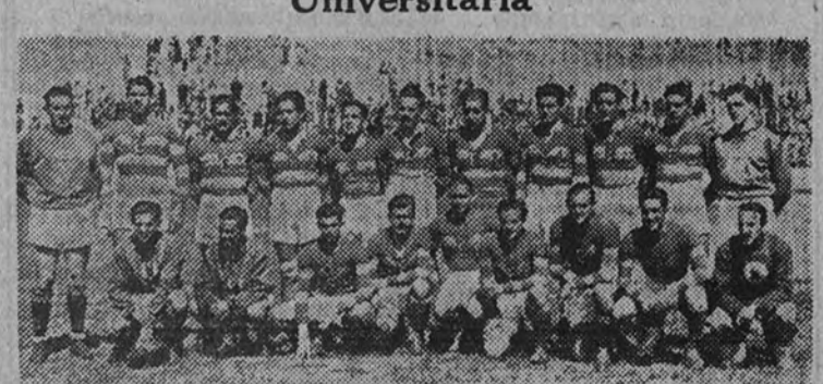
Ayer por la mañana llegó a Madrid el equipo del Barcelona, que hoy por la mañana, en la Ciudad Universitaria, disputará al S. E. U. de Madrid la final del Campeonato de España

El equipo de rugby del S. E. U. de Madrid, que en la mañana de hoy disputa con el Barcelona la final del Campeonato de España