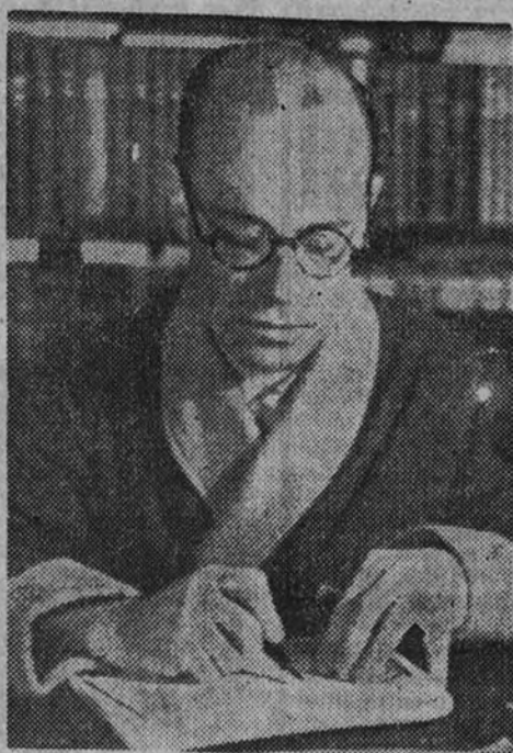
Joaquín de Entrambasaguas

En nuestros días buena parte del pensamiento español ha elegido el ensayo como campo más fértil para sus reflexiones sobre los distintos problemas de la cultura. Un sentimiento de honda preocupación por los destinos de España se produce en los medios intelectuales a raíz de la crisis del Imperio. Dos escritores y hombres públicos—ambos magníficos ensayistas—se disputaron a par-