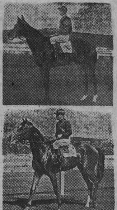
Los representantes de la Yeguada Militar, «Fusi-Yama» y «Fandanguillo», que se presentan como favoritos en el Premio de Su Excelencia el Generalísimo

De gala el día de hoy para la afición, porque el Premio de Su Excelencia el Generalísimo se celebra esta tarde. Quedando el Gran Premio de Madrid—el de mayor importancia en la temporada—, el hipódromo de La Zarzuela, además de lo que en él representa, bajo el nombre de "viejos". Siempre el aspecto deportivo siempre resulta interesante, por ser la primera prueba importante del calendario hipico madrileño en que se enfrentan los productos nacionales de la generación de "tres años" con los "viejos". Siempre el vencedor de la prueba resulta un buen lote de inscribir en la "lista de honor". Siempre el vencedor de la prueba resulta un buen lote de inscribir en la "lista de honor". Siempre el vencedor de la prueba resulta un buen lote de inscribir en la "lista de honor".