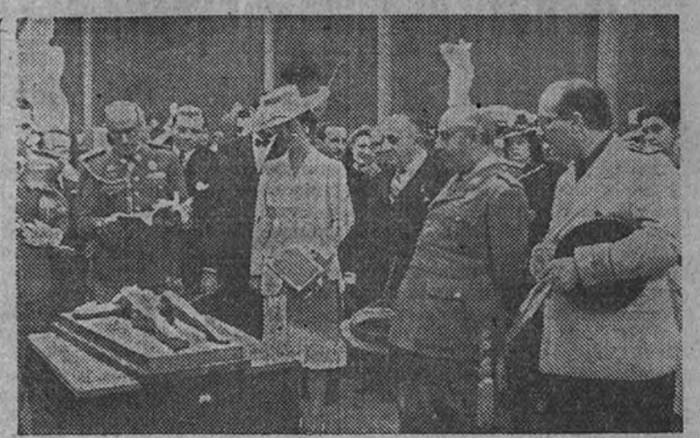
Su Excelencia el jefe del Estado, con su esposa y el Ministro de Educación Nacional, contemplando las obras de escultura en la Exposición Nacional de Bellas Artes durante el solemne acto inaugural celebrado a mediodía de ayer.