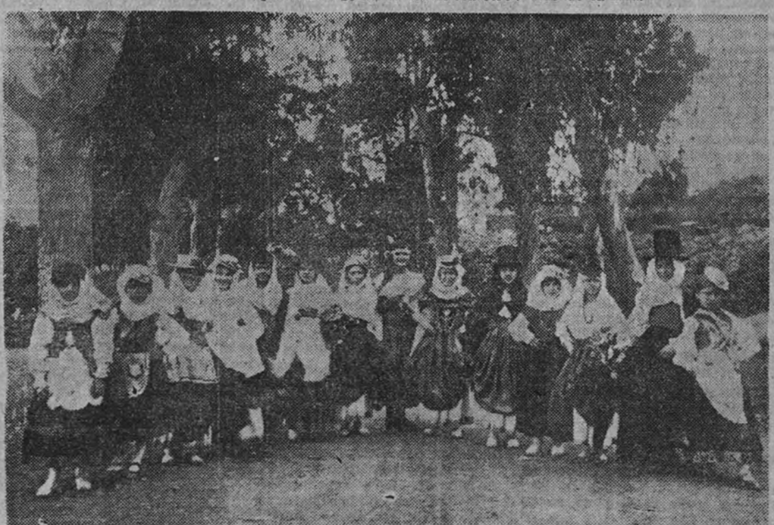
Trajes típicos de los catorce pueblos de la Isla de La Palma (Canarias)

Y éstas son, en suma, las características más destacadas de la Isla de La Palma y los problemas más apremiantes, cuya solución ha sido abordada con el mayor celo y diligencia por el Cabildo con el importante plan de obras, del que anteriormente hemos informado, y que contribuirá en alto grado al desarrollo y florecimiento de los intereses generales de la Isla.