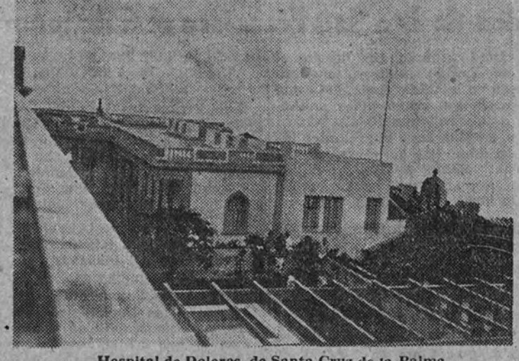
Hospital de Dolores, de Santa Cruz de la Palma

El clima es muy benigno y sano, siendo la mejor prueba de sus condiciones de salubridad la ausencia total de enfermedades de carácter epidémico. La temperatura, no pasa generalmente, de 29 grados, incluso en los días más calurosos, y rara vez desciende