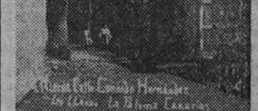
Rincón de Los Llanos

En el problema sanitario-beneficio se llevarán a cabo las siguientes obras: construcción de un edificio con destino a Centro de Higiene y Maternal de Urgencia en Santa Cruz de la Palma, otro centro de