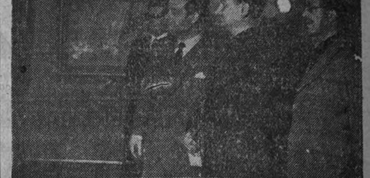
El Ministro Secretario del Movimiento, camarada Arrese, en la visita que hizo a la Exposición de Agustín Segura en el Salón Cano

Los Ministros de Asuntos Exteriores y Educación Nacional con el director general de Bellas Artes y el presidente de la Asociación de la Prensa en la inauguración de la Exposición del señor Alvarez de Sotomayor que se celebra en el Museo de Arte Moderno