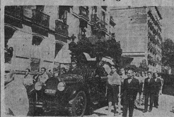
Entierro del representante del Gobierno francés en España. La comitiva fúnebre a su paso por las calles

El traslado desde la Embajada francesa a la estación fué presidido por los Ministros de Asuntos Exteriores y Agricultura