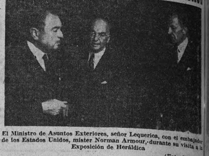
El Ministro de Asuntos Exteriores, señor Lequerica, con el embajador de los Estados Unidos, señor Norman Armour, durante su visita a la Exposición de Heráldica.

En la Sala de Estampas del Museo de Arte Moderno, será inaugurada esta tarde, a las siete, una importante Exposición de emblemas, heráldica y escudo, organizada por el Fomento de las Artes Decorativas de Barcelona.