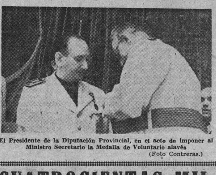
El Presidente de la Diputación Provincial, en el acto de imponer al Ministro Secretario la Medalla del Voluntario Alavés

BENDICION DEL MONUMENTO A LOS CAIDOS Antes de la hora prevista para el comienzo del programa oficial, las calles próximas al monumento erigido a los caídos, levantado en la calle del Marqués de Estella, estaban cubiertas por las juveniles formaciones falangistas de uno y otro sexo. Más tarde fueron llegando las Centurias encargadas de rendir honores al Ministro y las fuerzas de Infantería que tenían la misma misión. Después lo hicieron los niños de los colegios de la ciudad con sus profesores, Alcaldes de los Ayuntamientos alaveses, presidentes de las Juntas Administrativas de los pueblos, afiliados de los sindicatos, etc. A las once llegó el camarada Arrese, rindiéndole honores las fuerzas antes mencionadas, que después revistó. Seguidamente el vicario general de la diócesis, en representación del prelado, bendijo el monumento y los banderines de varias Centurias de Vitoria y pueblos de la provincia. EL CAMARADA ARRESE IMPONE LAS MEDALLAS DE LA VIEJA GUARDIA Después de la misa se leyó ante el micrófono el decreto creando la condecoración de la Medalla de la Vieja Guardia, y seguidamente se