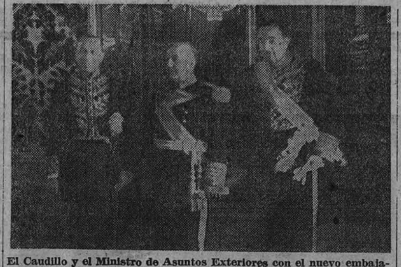
El Caudillo y el Ministro de Asuntos Exteriores con el nuevo embajador de la República Argentina

Después de celebrado el solemne acto conversó con el Caudillo durante una hora, en presencia del Ministro de Asuntos Exteriores