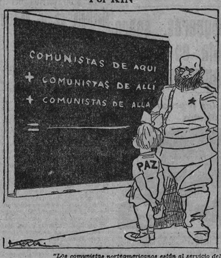
"Los comunistas norteamericanos están al servicio del nacionalismo ruso." (Del «New York Times».)

«¿Pues si que me pone usted un problema!...»