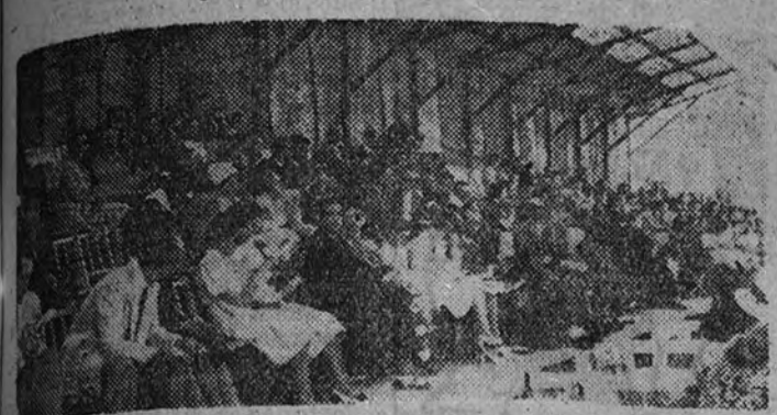
La Copa Diputación mereció la asistencia de muchos aficionados a la casa de la Casa de Campo, donde se celebró el concurso hípico internacional.

Se disputaron también las pruebas Anoria y Parejas Mixtas