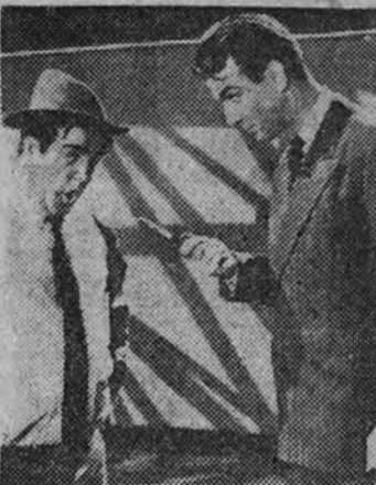
«Crimen a medianoche», creación de la pareja Abbott-Costello, se reestrena mañana en el cine San Miguel