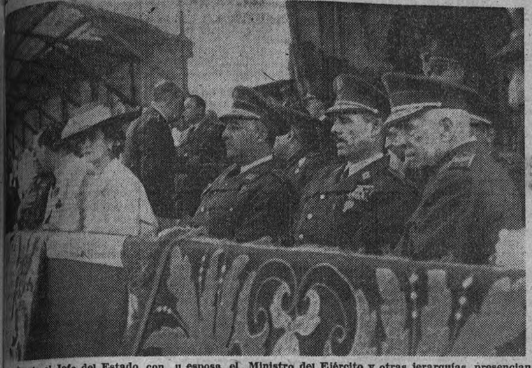
Presidencia el Jefe del Estado, con su esposa, el Ministro del Ejército y otras jerarquías, presenciando el concurso hipico internacional celebrado ayer tarde, y del cual damos amplia información en nuestra página deportiva

Caudillo fué aclamado con gran entusiasmo