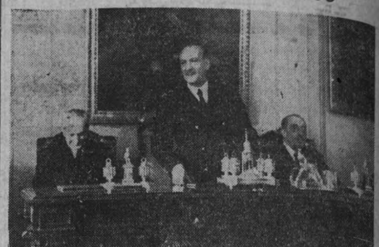
El Ministro de Obras Públicas dirigió la palabra a los nuevos ingenieros de Caminos

Ayer, en la Escuela Especial de Ingenieros de Caminos, Canales y Puertos, se celebró el acto de terminación de curso, correspondiente a 1944-45, presidiendo el Ministro de Obras Públicas, don Alfonso Peña, con la Dirección y profesorado.