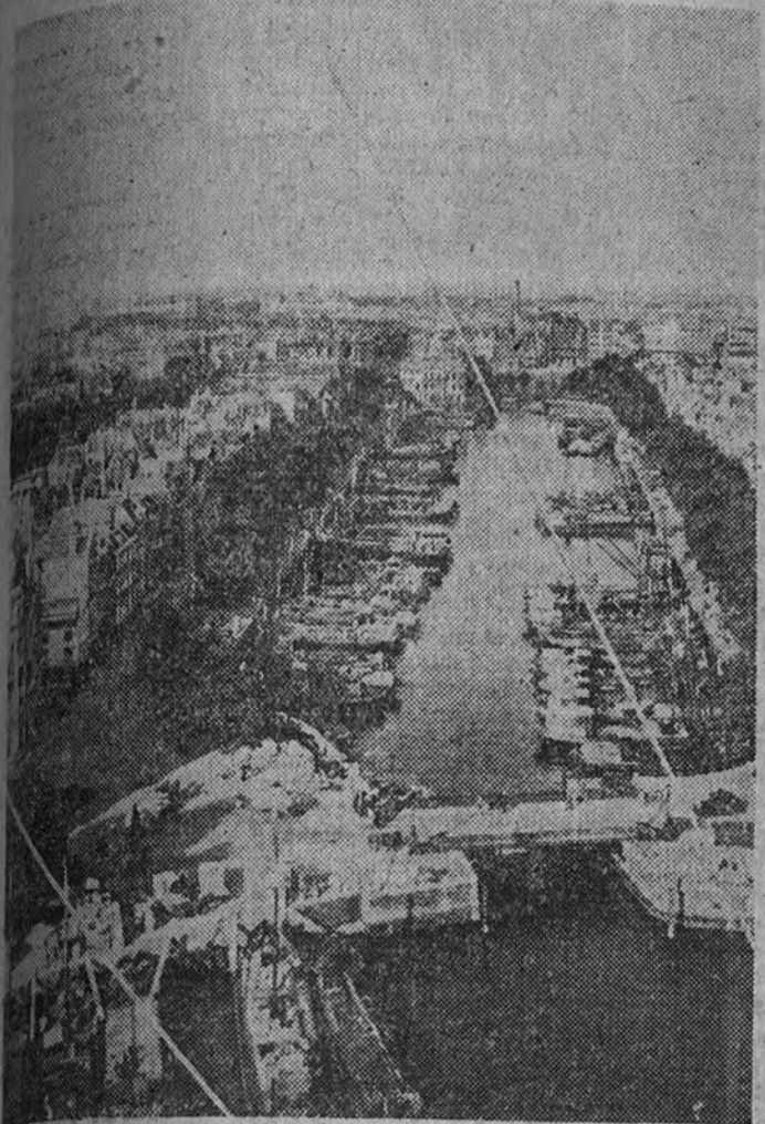
Una típica vista de Rotterdam

Es preciso reconstruir totalmente la zona devastada El plan de obras comprende un periodo de quince años