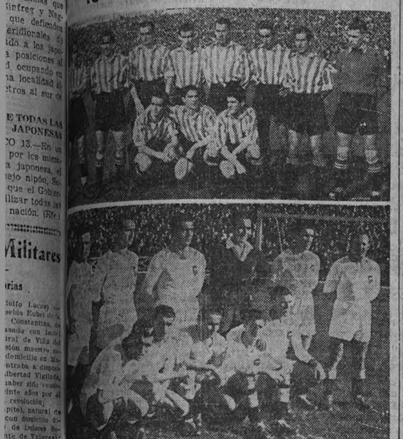
El Atlético de Bilbao y el Valencia, los únicos que en el mismo terreno que lo fueron el año último