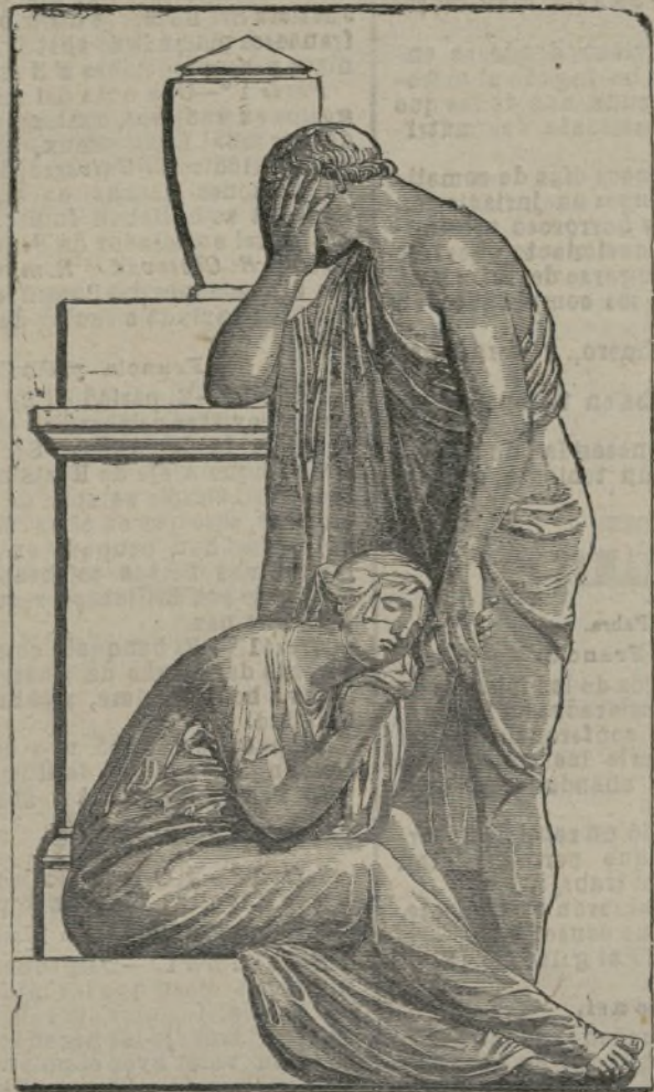
Un grupo de Flaxman.

algunas libertas; des hombres que la si- guen parecen ser sus esclavos; la puerta del mausoleo es grande y adornada de es- culpturas; sobre la fachada se ven dos ge- nios que sostienen un sanelabro.