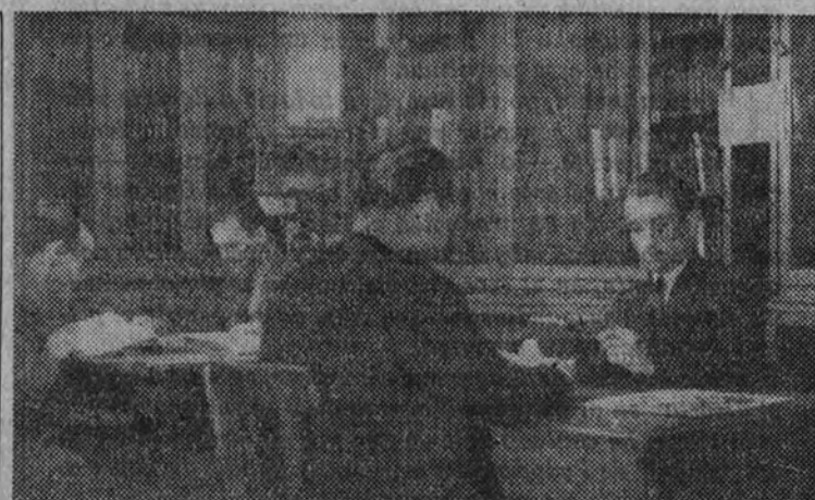
Un rincón de la biblioteca del Grupo de Empresa de la Unión Eléctrica Madrileña.