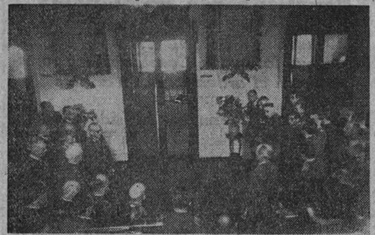
El Ministro del Ejército pronunciando un discurso de homenaje a los caídos del Cuerpo de Veterinaria Militar, ante la lápida descubierta ayer en el Laboratorio Militar.

El Ministro del Ejército rindió homenaje a los caídos y elogió los servicios prestados por este Cuerpo