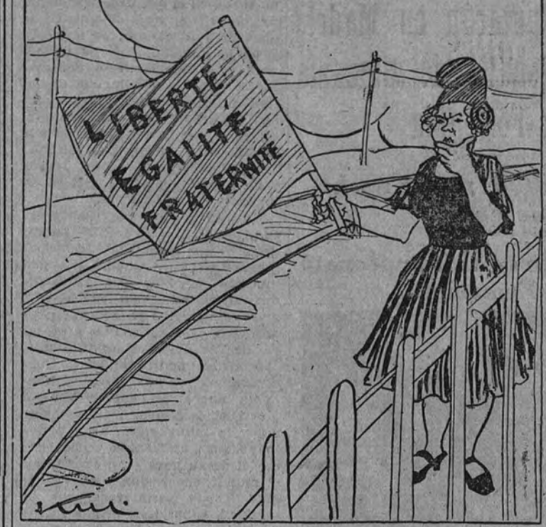
La guardabarrera.—¿Y qué hago yo con la banderita?