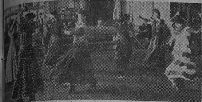
Las bailarinas regionales constituyen una de las cuatro pruebas del Campeonato nacional de Gimnasia de la S. F., próximo a disputarse

Este año han participado en el Campeonato las Juventudes Femeninas