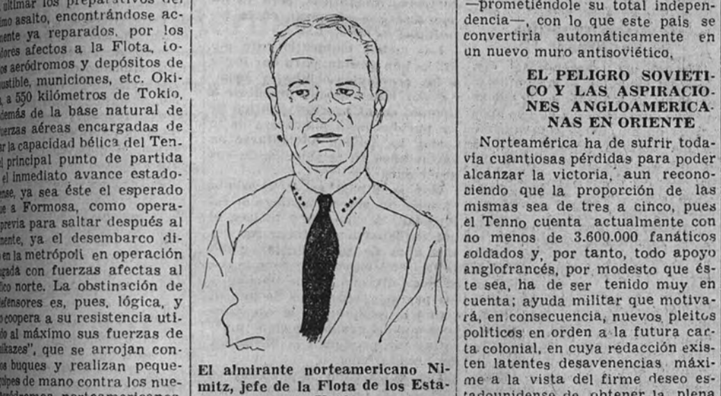
El almirante norteamericano Nimitz, jefe de la Flota de los Estados Unidos

El Gobierno Imperial ha movilizad... (text continues about Japanese naval strategy and the Yamato fleet's readiness for invasion).