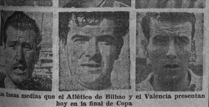
Las líneas medias que el Atlético de Bilbao y el Valencia presentan hoy en la final de Copa

BARCELONA 23. (De nuestro enviado especial.) Continúan las preparaciones para la celebración del partido final de la Copa de Su Excelencia el Generalísimo. Pero no diríamos la verdad si no dijéramos que el partido, en sí mismo, no tiene gran importancia deportiva. Pero que, en esta ocasión, el resultado, que se da muy fácil para el equipo de Bilbao, ha restado bastante interés a la competición.