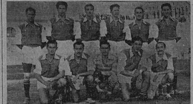
El equipo del S. E. U. de Madrid, que en la final del Campeonato de balón a mano hizo un espléndido partido, siendo vencido por 3-2

Venció al S. E. U. de Madrid, en una final muy reñida, por 3-2