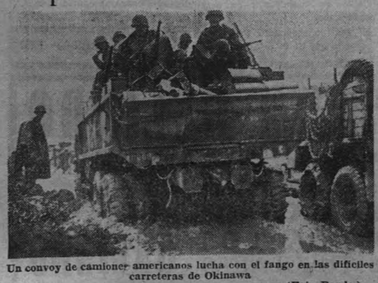
Un convoy de camiones americanos lucha con el fango en las difíciles carreteras de Okinawa.