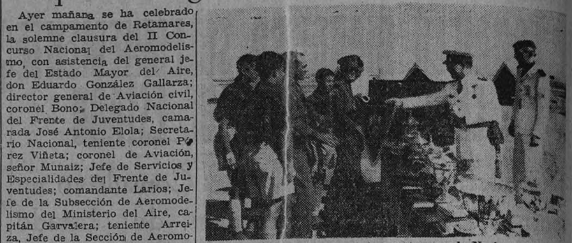
El jefe del Estado Mayor del Aire y el Delegado Nacional del Frente de Juventudes durante la entrega de premios y distintivos en la clausura del concurso de aeromodelismo.

Presidió el general jefe de E. M. del Aire, quien entregó los premios y distintivos