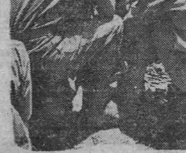
Soldados norteamericanos atacando a los japoneses que defendían Naha, la capital de Okinawa.