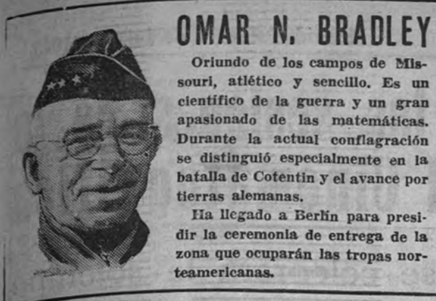
OMAR N. BRADLEY

Oriundo de los campos de Missouri, atlético y sencillo. Es un científico de la guerra y un gran apasionado de las matemáticas. Durante la actual conflagración se distinguió especialmente en la batalla de Cotentin y el avance por tierras alemanas.