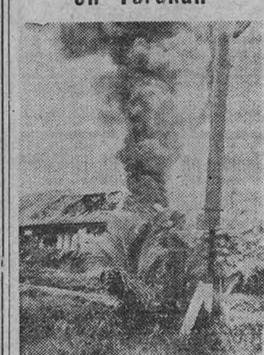
Poco después del desembarco en Tarakán este soldado australiano, utilizando un periscopio abandonado por los nipones, observa los movimientos de éstos.