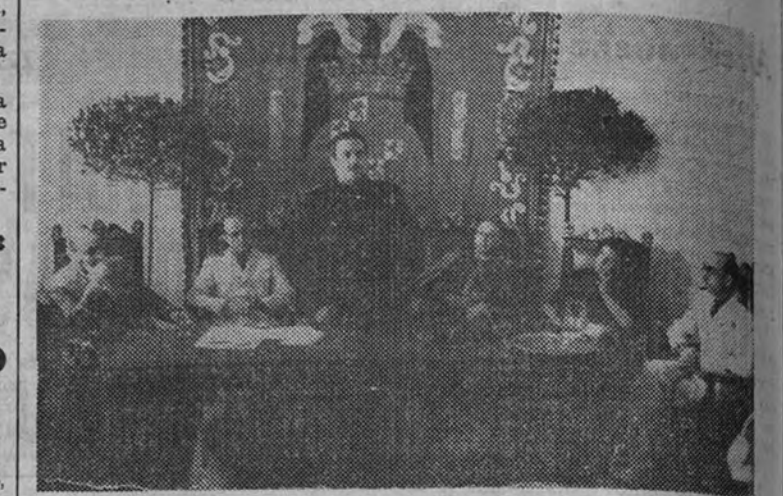
El Ministro de Trabajo durante el discurso que pronunció en la inauguración de las oficinas centrales de la Caja Nacional del Seguro de Enfermedad

Hay ya 6.630.000 personas que se benefician de este Seguro