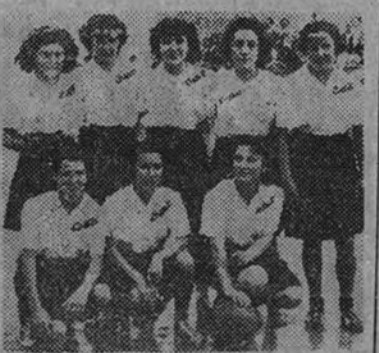
El equipo de Corte de Barcelona, actual campeón de España de baloncesto de Educación y Descanso, que disputa hoy la final con el Glut de Alicante

Más comprometido el equipo catalán, con más empuje y calidad individual en las alicantinas. Nos inclinamos por el juego de conjunto, si no hubiéramos visto una gran facilidad en las levantas para encestar. La final masculina aún tiene menos puntos de referencia: Talleres de Aviación de Baleares ganó ampliamente en la semifinal a los asturianos y entre sus componentes hay elementos prometedores que saben desmarcarse bien y tirar con acierto, pero tengamos en cuenta que su rival, Hidroeléctrica del Chorro de América—ga-