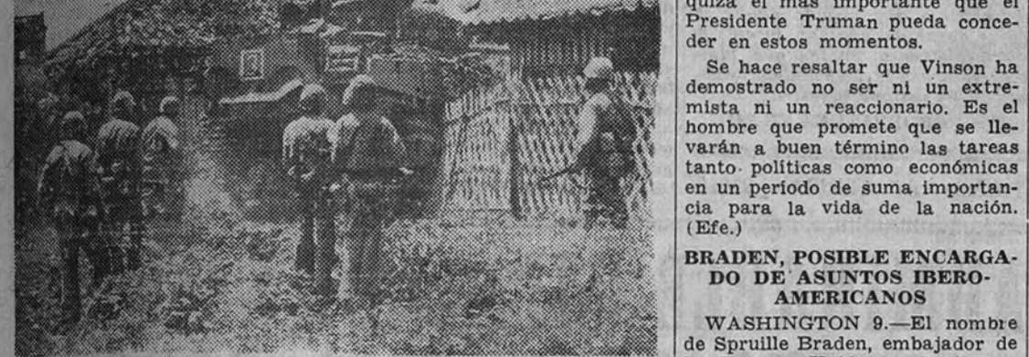
Un tanque americano, irrumpiendo por entre los muros de los edificios, abre camino a la Infantería que le sigue, en el avance sobre la capital de Okinawa, Naha.