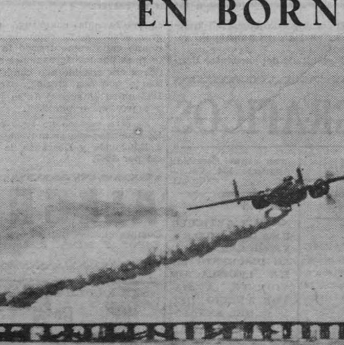
Un bimotor norteamericano extiende una cortina de humo para proteger las operaciones aliadas en un punto de Borneo