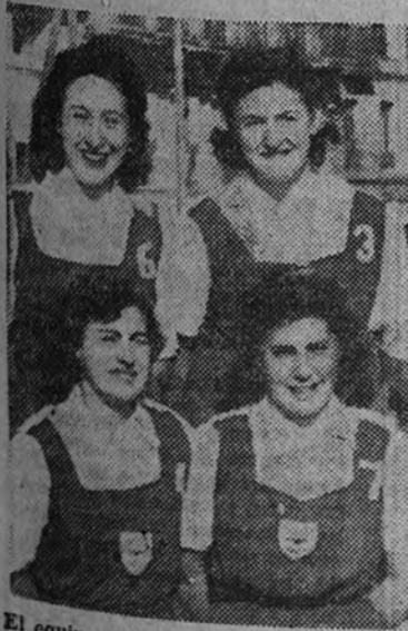
El equipo del Centro de la S. F., actual campeón de España de baloncesto

Si el equipo Centro logra la victoria se adjudica en propiedad la Copa de Su Excelencia el Generalísimo