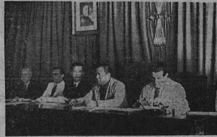
Presidencia del acto inaugural de la Junta Nacional Sindical de la Piel