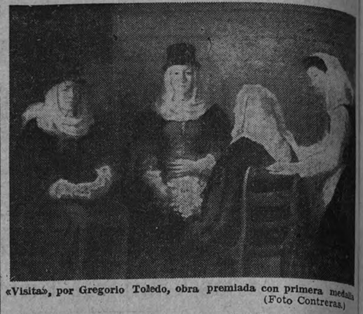
"Visita", por Gregorio Toledo, obra premiada con primera medalla

Esta posición corresponde al joven pintor Gregorio Toledo en su cuadro "Visita", la obra más bella y espectacular de la Exposición, si se exceptúan los envíos de los artistas aspirantes a la Medalla de Honor. Tanto en los recursos estilísticos como en el espíritu la creación a que se refiere el título remembrandiano, a costa del cual el dato folklórico cobra un extraño valor. La actitud estática de las figuras, idealizadas en el fulgor mágico de un claroscuro que hace vibrar los blancos—finamente empastados—y el carmin bellísimo de los ropajes; la tensión espiritual de las cabezas, apenas descritas y nada realistas, y la gracia leve del tratamiento, muy somero, prestan a esta obra un raro atractivo. Todo se halla aquí sacrificado a la impresión de conjunto: la percepción de los detalles, el análisis de la forma en las figuras—sobre todo el estudio de las manos—, la profundidad de la esce-