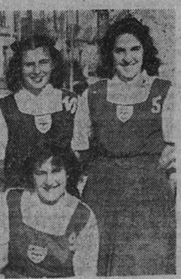
El equipo del Centro de la S. F., actual campeón de España de baloncesto

Si el equipo Centro logra la victoria se adjudica en propiedad la Copa de Su Excelencia el Generalísimo