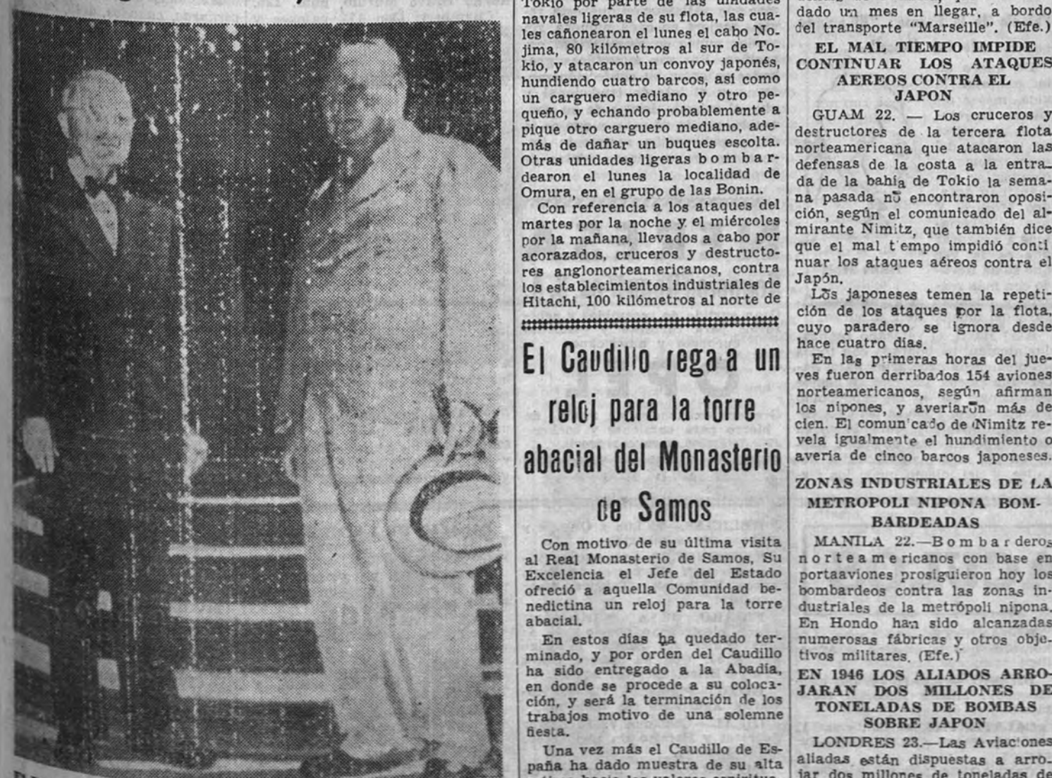
El Presidente Truman y Winston Churchill, jefe del Gobierno inglés, se plean en las escaleras de la residencia del primero en la zona donde se celebra la conferencia de Berlín.

El Ministro de Asuntos Exteriores recibirá hoy al Cuerpo diplomático