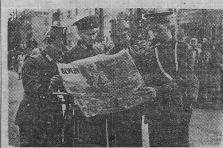
Estos tres miembros de la nueva Policía urbana berlinesa explican a un soldado inglés la situación de varias calles con ayuda de un plano de la capital alemana.