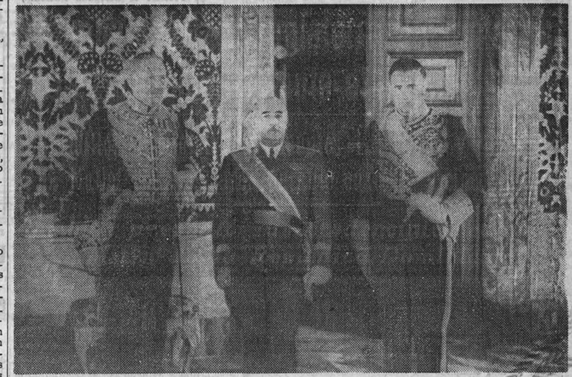
El Caudillo, acompañado del Ministro de Asuntos Exteriores y del embajador de Inglaterra, en el acto de la presentación de credenciales