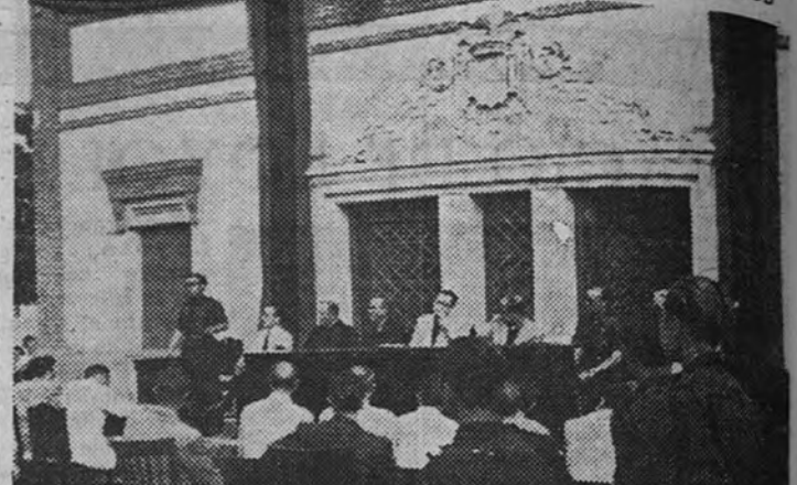
Presidencia de la Asamblea plenaria de la Hermandad Sindical del campo, celebrada en Villaverde

PRESIDIO EL DELEGADO PROVINCIAL DE SINDICATOS