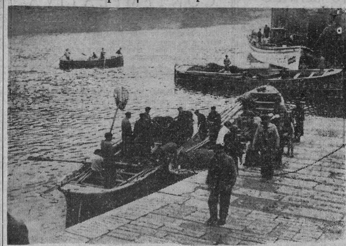
Los pescadores que emplean artes nobles para la pesca se ven sorprendidos por los dinamiteros del mar, haciendo que pierdan días y trabajo por falta de bancos de sardinas, que ahuyentaron por el empleo de explosivos

Su empleo causa grandes daños en la riqueza pesquera española