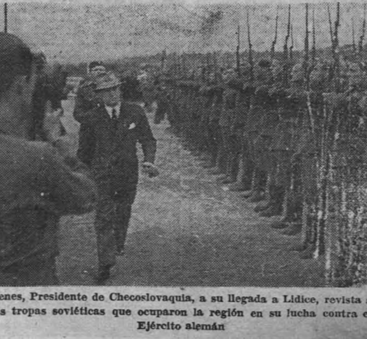
Benes, Presidente de Checoslovaquia, a su llegada a Lidice, revista a las tropas soviéticas que ocuparon la región en su lucha contra el Ejército alemán