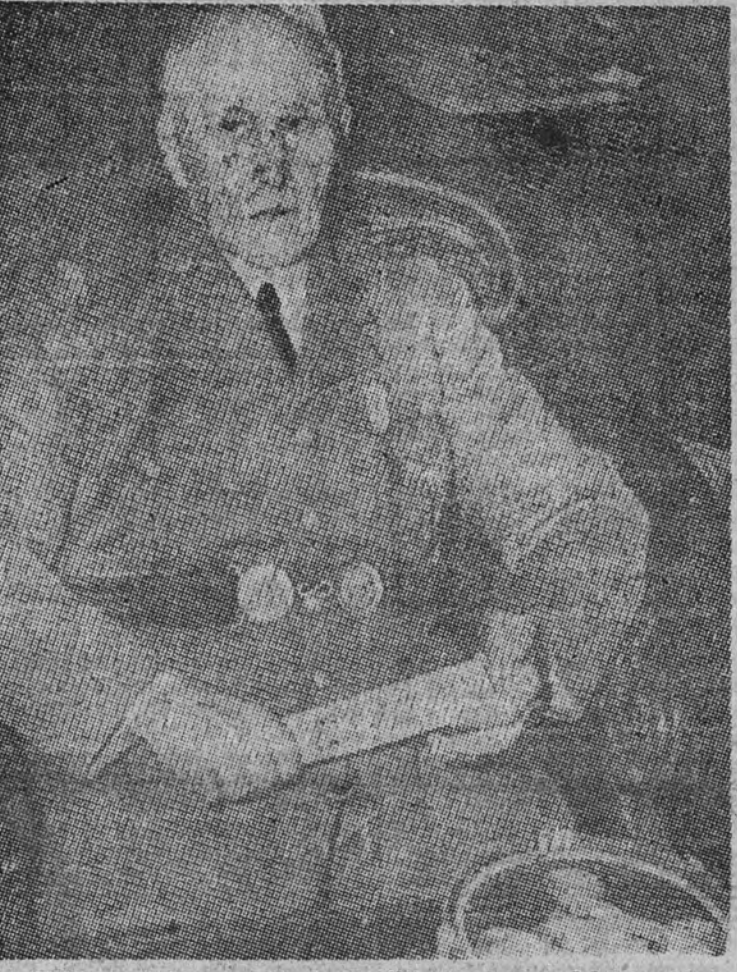
El Mariscal durante una de las últimas sesiones del proceso

Arrighi manifestó que el país se indignó cuando Pétain «mandó a la muerte a muchos jóvenes vestidos con uniforme alemán para