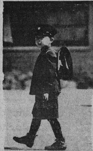
Aki-Hito, primer hijo varón de Hiro-Hito y heredero del Mikado, que, según las últimas noticias, va a ser coronado Emperador por abdicación de su padre

«El Gobierno japonés tiene el honor de contestar a los Gobiernos de las cuatro potencias aliadas diciendo: «Su Majestad el Emperador ha proclamado un decreto imperial sobre la aceptación por parte del Japón de los acuerdos contenidos en la declaración de Potsdam. Su Majestad está dispuesto a auto-