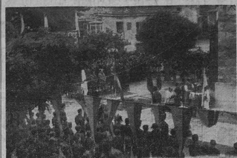
Aspecto de la plaza de Cervera de Pisuerga durante el acto de bendición e inauguración del monumento a los Caídos

Presidió el Delegado Nacional de ex Cautivos