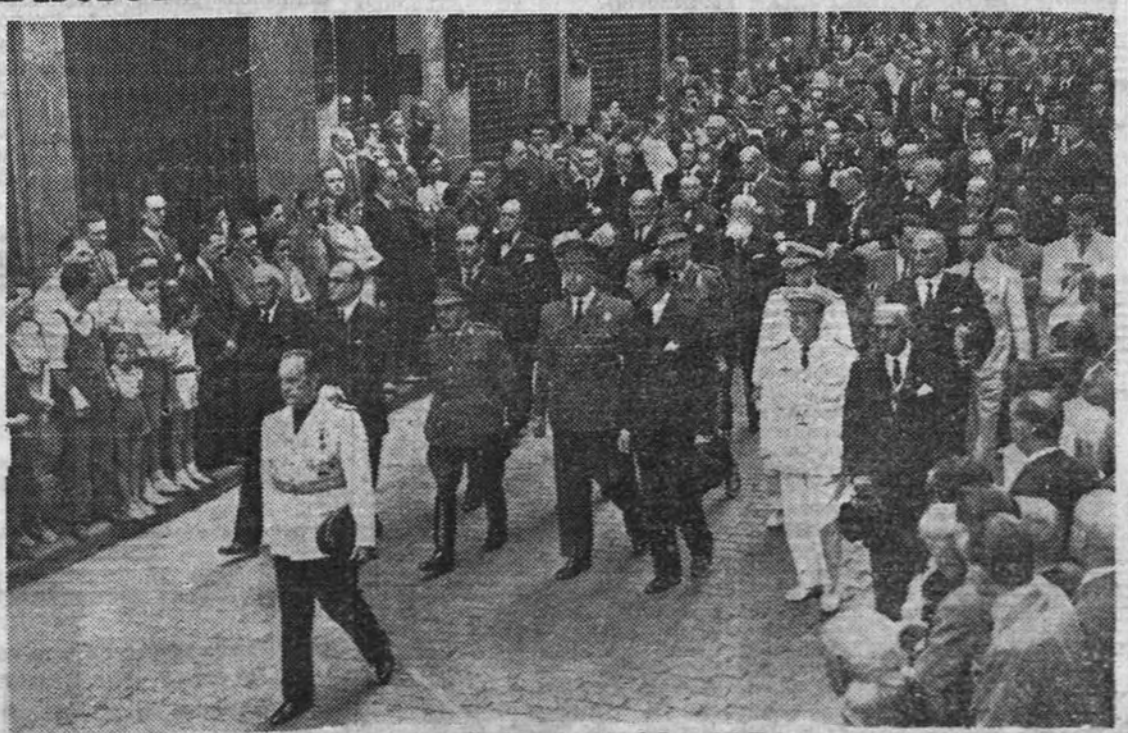
El Ministerio de Justicia, que representaba a Su Excelencia el Jefe del Estado, al frente de la presidencia de la fúnebre comitiva, en la que figuraban los Ministros de la Gobernación, Ejército, Educación Nacional y Agricultura