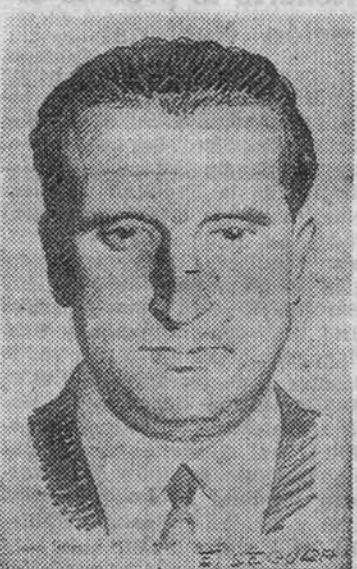
El excelentísimo señor Ministro de Asuntos Exteriores