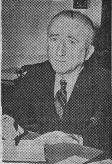
El secretario de Estado norteamericano, M. Byrnes

Declaraciones de Byrnes en su primera conferencia de Prensa