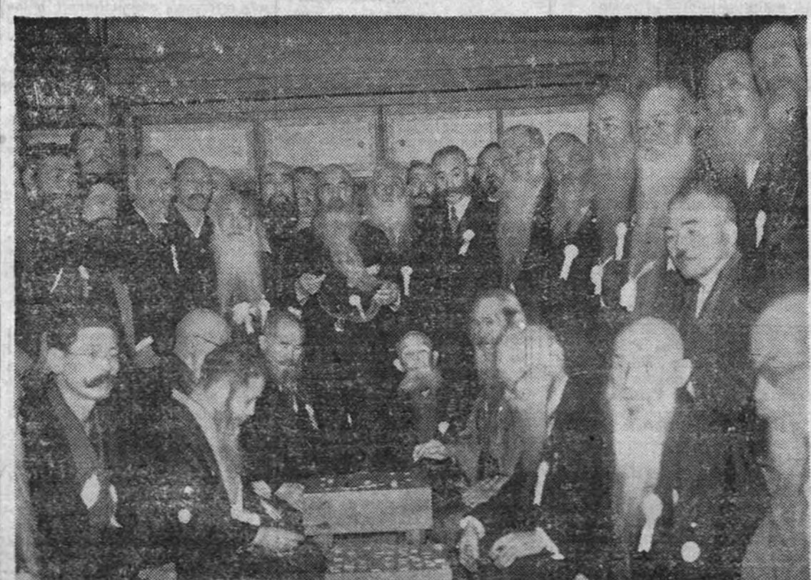
El Gobierno japonés ha prohibido a su pueblo la fraternización con los vencedores. Como consecuencia de esta medida, los soldados aliados no podrán asistir a las reuniones de este club, uno de los más aristocráticos y tradicionales de la capital nipona.