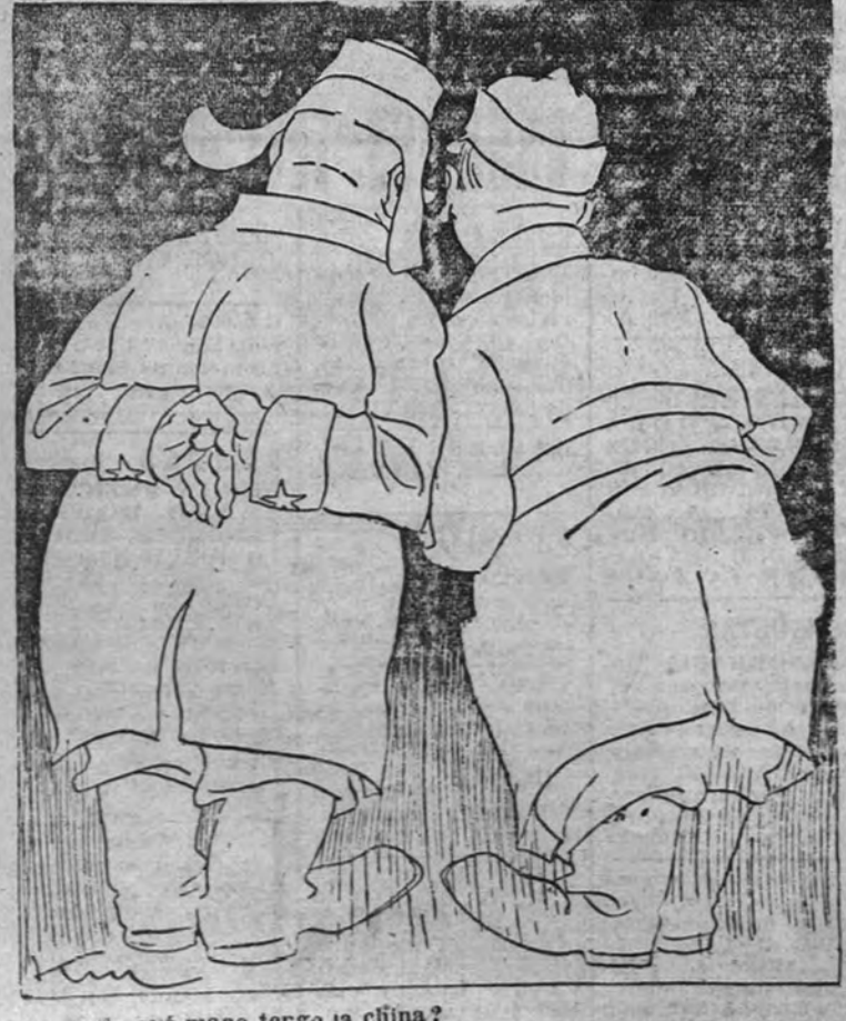
—¿En qué mano tengo la china?