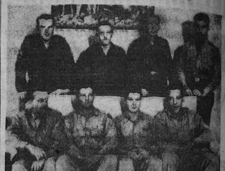
Los oficiales y soldados de la Aviación norteamericana, que se encuentran estos días en Valencia

Los aviadores que se hallan en Valencia creyeron que iban a encontrar un país hosco, en el que menudeaban los incidentes