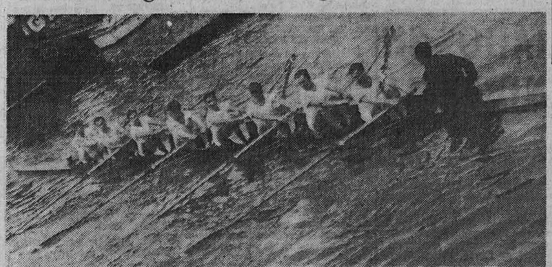
El equipo portugués de remeros a ocho, que en el último tercio de la regata consiguió alcanzar y batir al equipo español

Dos largos de ventaja obtuvieron los remeros portugueses en la segunda regata