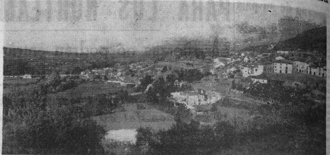
Vista panorámica de Loja

La aprobación del proyecto de aumento del caudal de agua solucionaría un viejo y agobiante problema