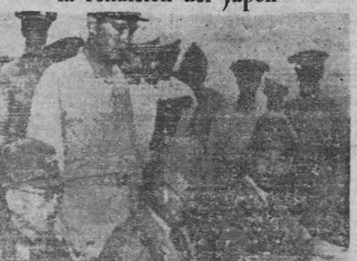
El almirante W. Whiting, de pie, contempla cómo el contraalmirante japonés Matsuo-Ja firma la rendición de la isla Marcus, a bordo de un barco americano.

Es posible que Espil, embajador argentino en España, sea trasladado a Washington