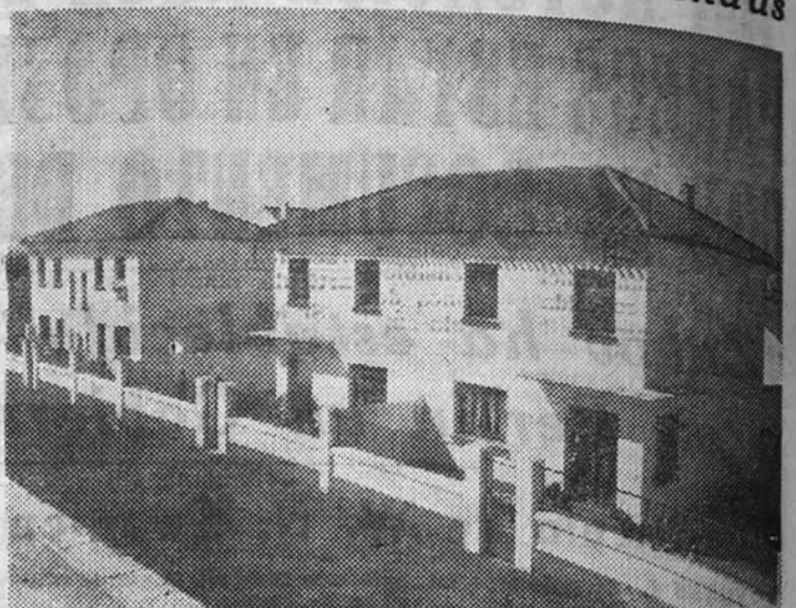
En todo el ámbito nacional se construyen actualmente numerosas viviendas protegidas. Un aspecto de la barriada "Hogar Nacionalista", de Albalade.

Una de las ciudades de España más afectada por el problema de la escasez de viviendas ha sido Madrid. No debemos olvidar, para