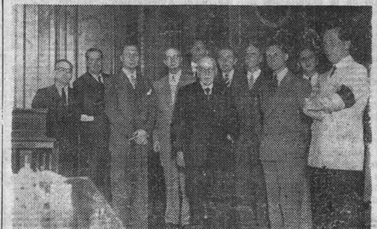
En San Sebastián, las Comisiones belga y española, con el Presidente de la Diputación, posan en el salón de sesiones de dicha Corporación antes de llevar a cabo las negociaciones comerciales entre ambos países

“Estas negociaciones asegurarán la rápida normalización de las relaciones entre Madrid y los países negociadores”, dice “Financial Times”