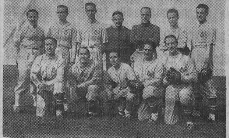
El equipo del Español, actual campeón nacional, que, en unión del Hércules y el Barcelona, representará a Cataluña en el Campeonato de España que comenzará a disputarse en Madrid el próximo sábado.

El próximo sábado, en el campo de Vallecas, dará comienzo el campeonato de España de pelota base. Seis equipos disputarán en Madrid el campeonato nacional de pelota base. El equipo de Barcelona, el "Hércules", es el favorito de la competición. El equipo de Barcelona, el "Hércules", es el favorito de la competición. El equipo de Barcelona, el "Hércules", es el favorito de la competición.