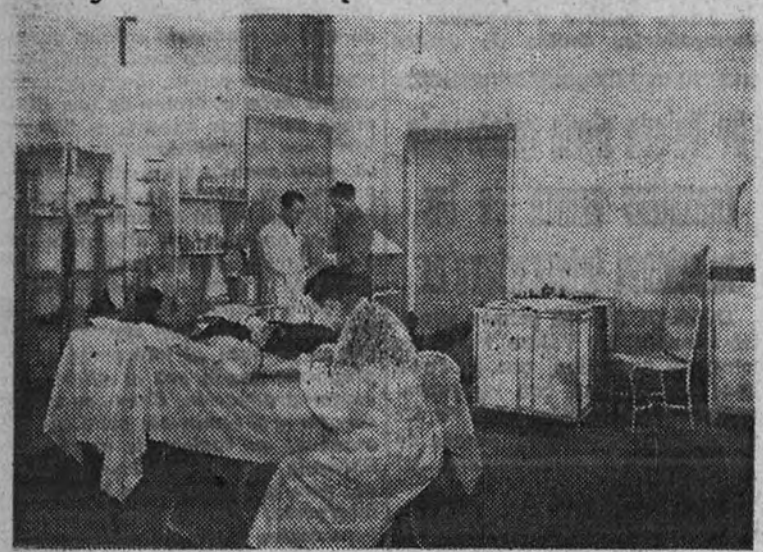
Modernas clínicas y consultorios del Seguro de Enfermedad

En la segunda etapa de su implantación quedarán incluidos la totalidad de los productores españoles y serán ampliados los servicios de medicina