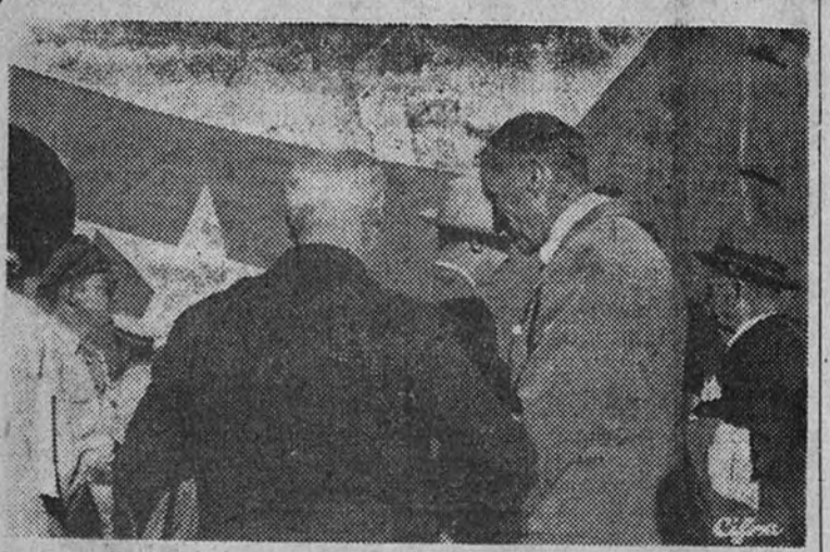
El embajador de los Estados Unidos en España, señor Norman Armour, conversa con los diputados norteamericanos a su llegada al aeródromo

Fué recibida en Barajas por el embajador norteamericano señor Armour